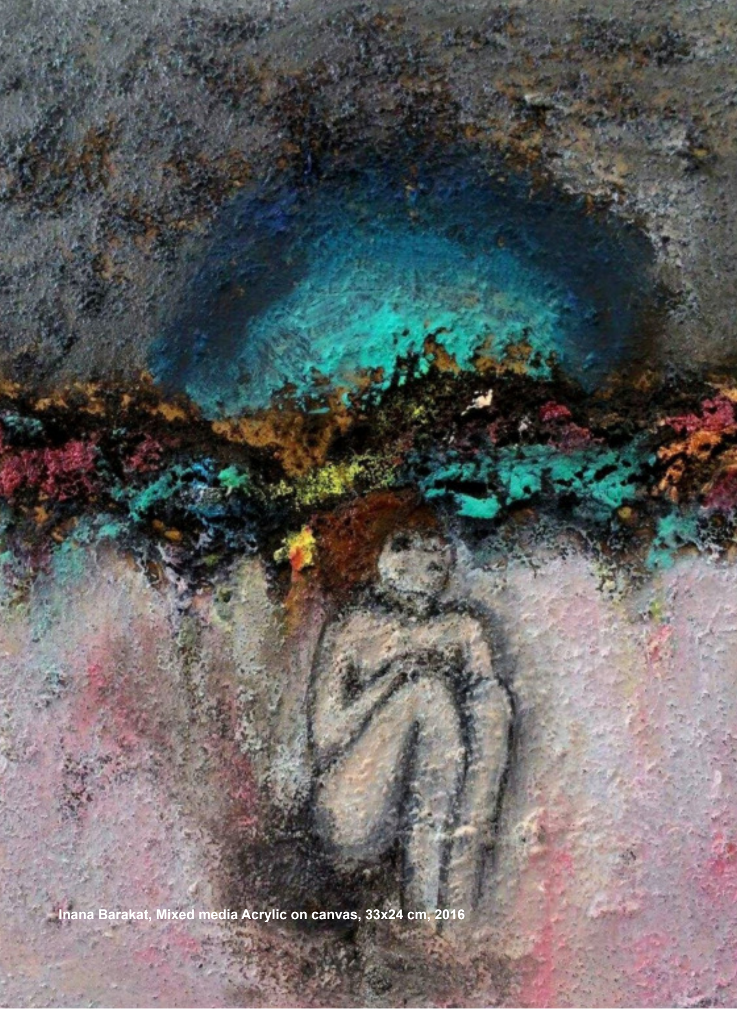
Inana Barakat, Mixed media Acrylic on canvas, 33x24 cm, 2016