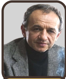
صادق يالسيز أوتشانلار

ولد في مدينة ملاطيا عام 1962، وهو أحد أهم الكتاب الأتراك المعاصرين. نشأ في بيئة ثقافية أتاحت له منذ نعومة أظفاره أن يعيش عالم التخيل والحكايات. نشر عددًا كبيرًا من الروايات والمجموعات القصصية وكذلك كتبًا ضمت أبحاثًا في ميادين الأدب والسينما والقضايا الاجتماعية.