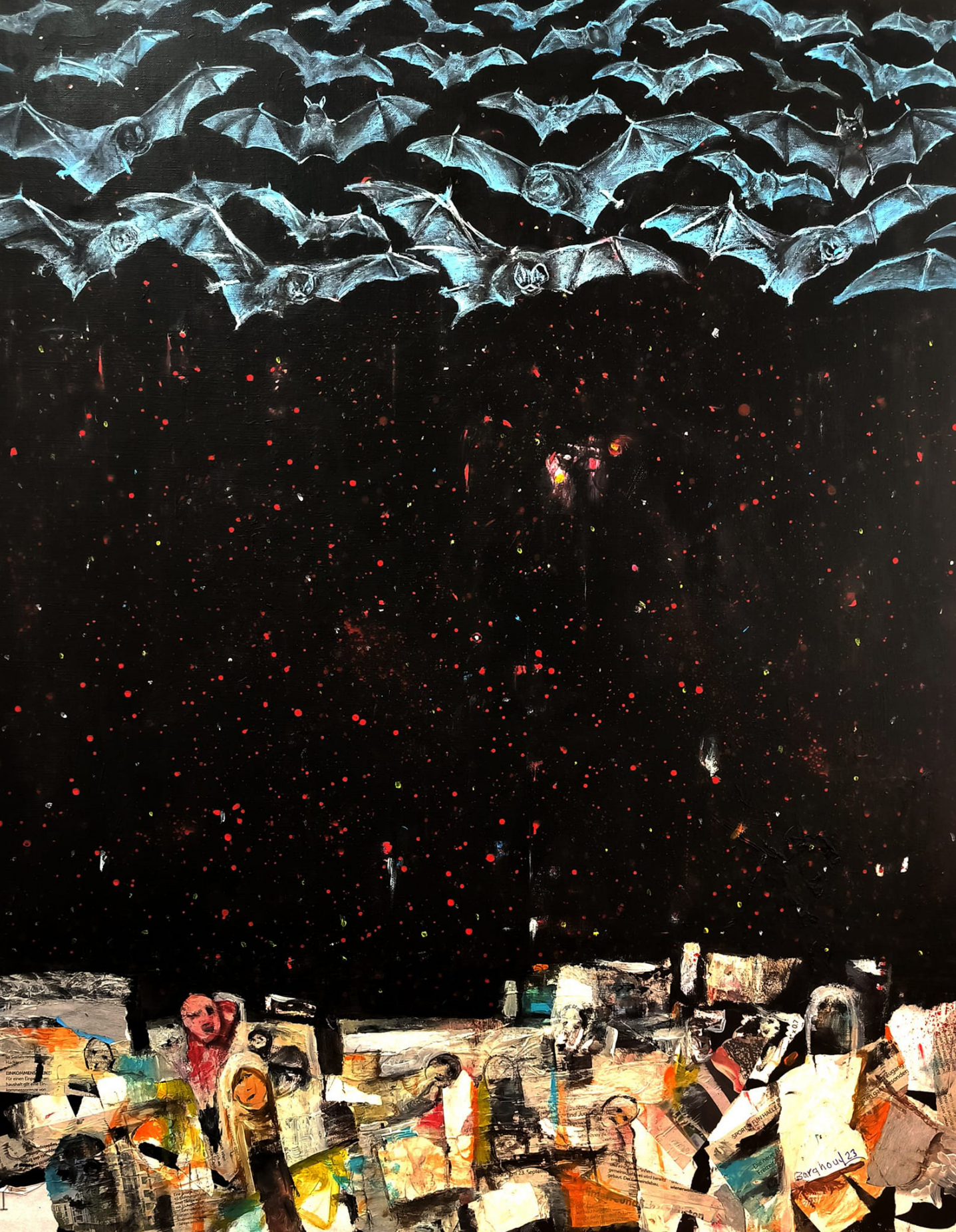
لوحة للفنان التشكيلي السوري إبراهيم برغود